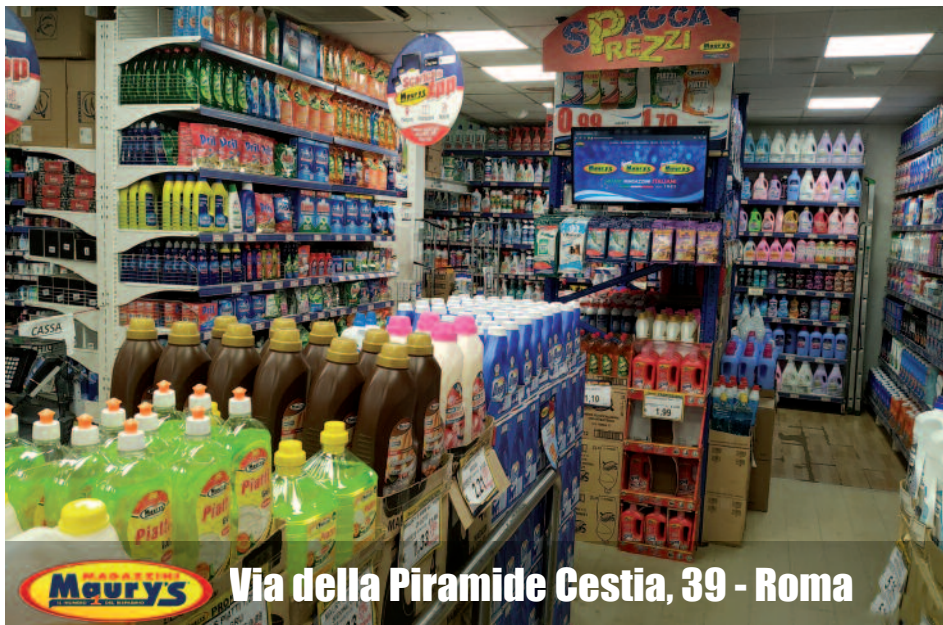
Via della Piramide Cestia, 39 - Roma